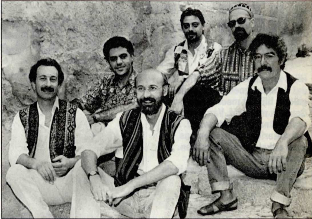
▲ De Siciliaanse groep Taberna Mylaensis.

In de Vlaamse groep Nie Neute zijn eveneens folkinvloeden terug te vinden. De band is geïmponeerd rond zanger, multi-instrumentalist