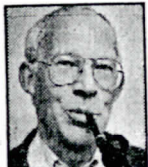
door Jaap D. Homan