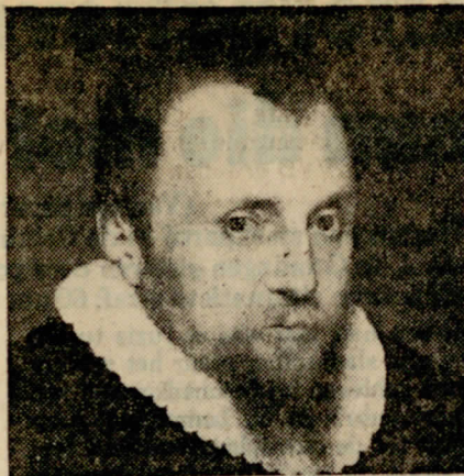
Portret van Ubbo Emmius op 41 jarige leeftijd door een onbekende schilder.