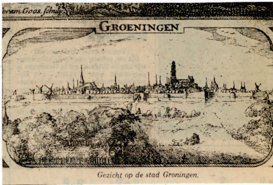
Gezicht op de stad Groningen.

Na Groningen noemt Emmius Appingedam het vermaardst en het