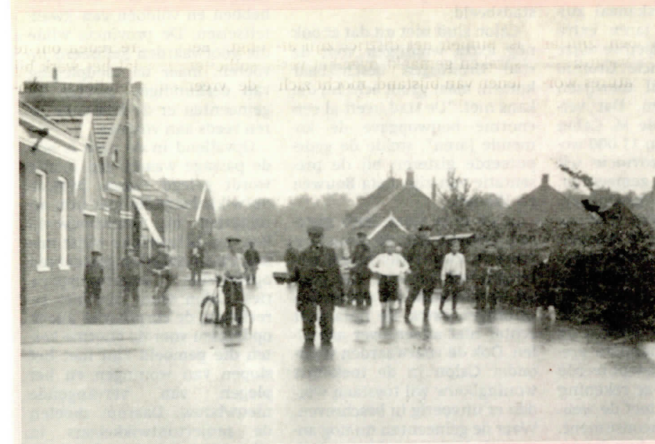
Wateroverlast aan de Spoorstraat na een wolkbreuk in 1915.