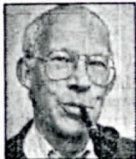
door Jaap D. Homan