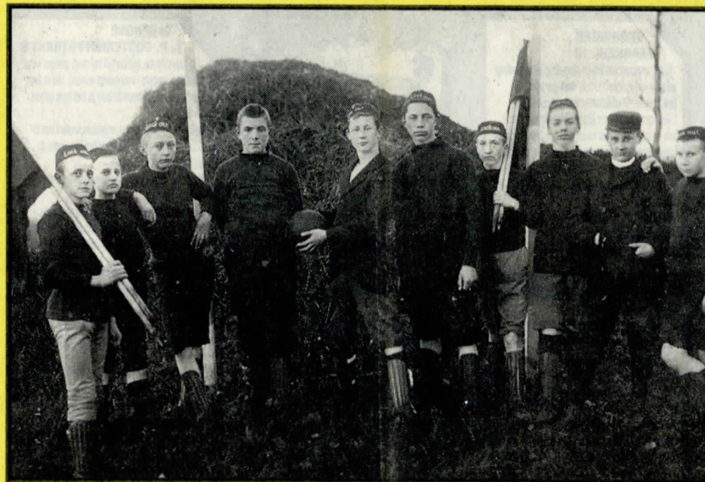
Het begin. De voetballers van Look Out in 1894.