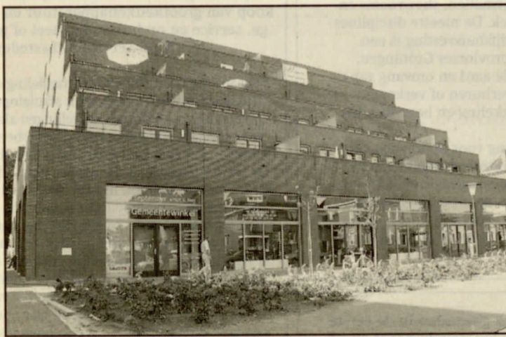
▲ Een in het oog springend appartementencomplex is verrezen op de plaats van het vroegere Veenlust.