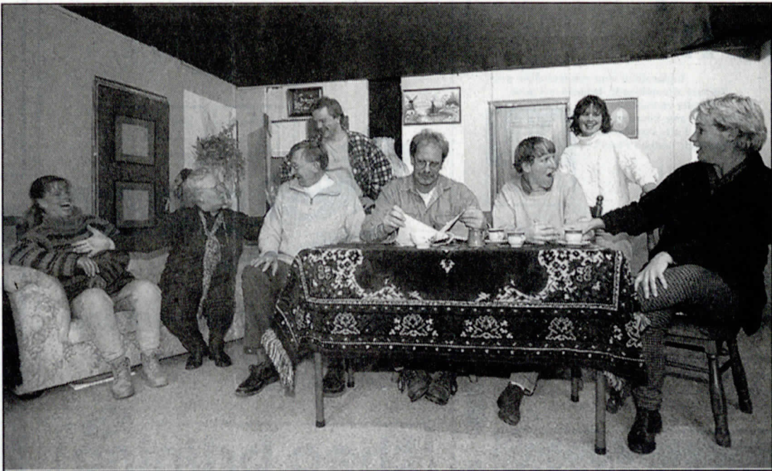
▲ Leden van Vileria tijdens de repetities in het dorps huis in Westerbroek.

'Vooruitgang Is Onze Leus En Rederijken Is Aangenaam'. Dat is voluit de naam van de to-