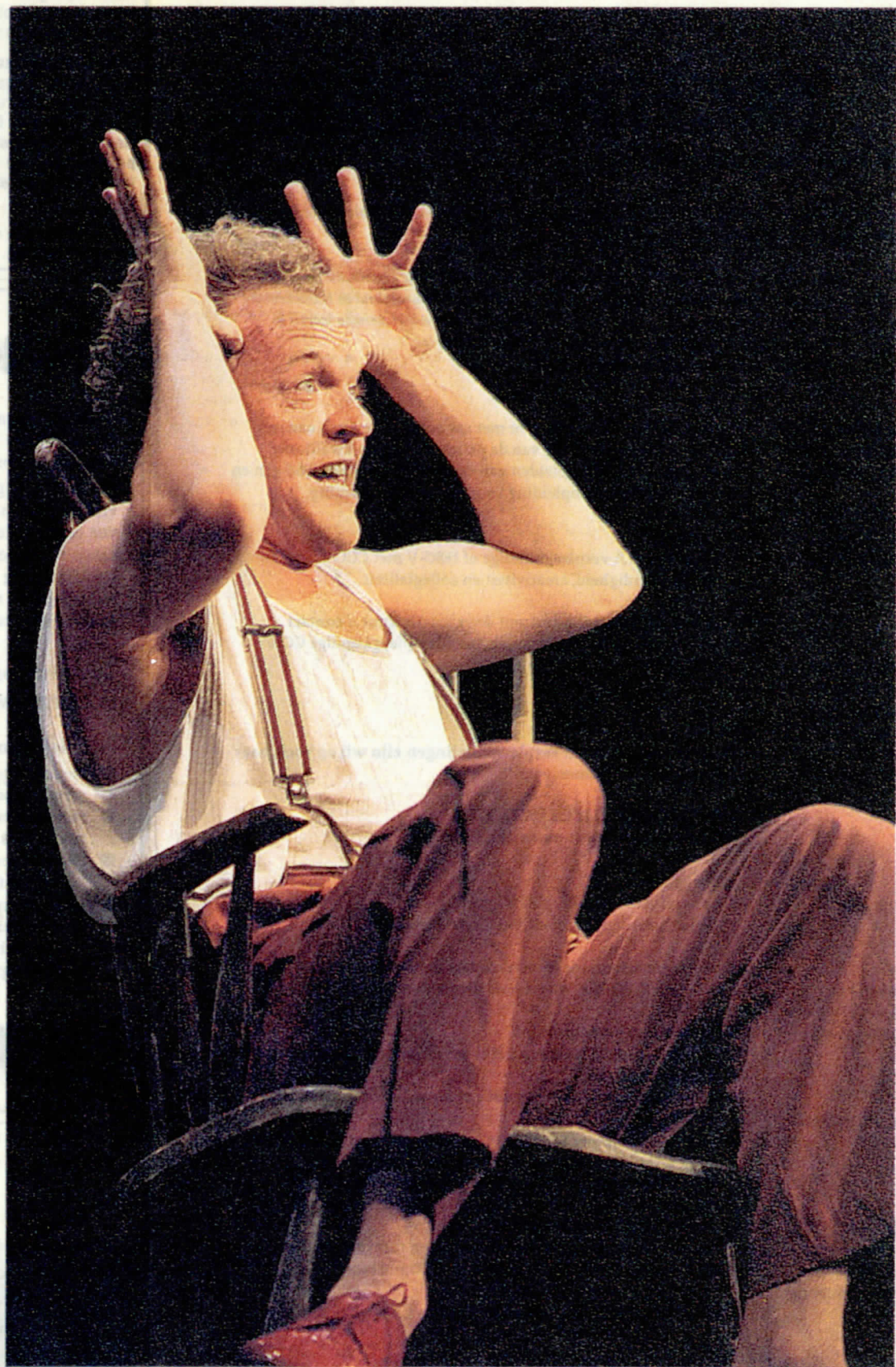
Bert Visscher in de finale van zijn theatershow 'Voor ons hoeft het niet' in de Groninger schouwburg.

ook tevreden. Groningen was echter niet leuker of beter dan het elders was. Ik had dit programma in elk theater kunnen opnemen. We hadden een wereldseizoen. Beter dan ooit. Elke keer weer zeg ik dat de laatste de beste show uit mijn carrière was. Ik weet het niet. Dat zei ik de vorige keer ook. Maar toen ik mijn programma Jammer terugzag, waren er wel een paar 'zakken', een paar stukken die te lang waren. Ik moet niet teveel drammen, vooral niet teveel schmieren."