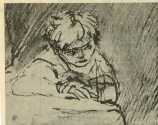
▲ ...Veur mie op t toavelswilk lag t dubbeltje al...