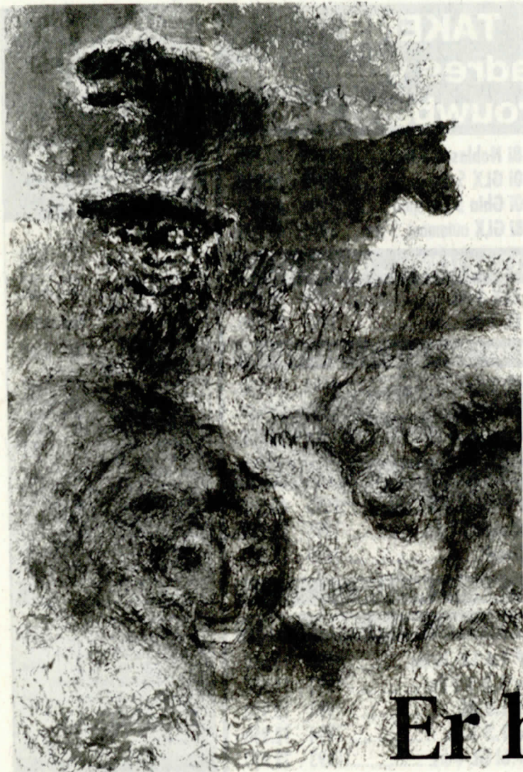
Hendrik de Vries: fantastische dieren (pentekening).