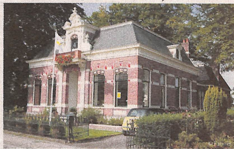
Ook in Beerta was dit woonhuis voor het publiek geopend.