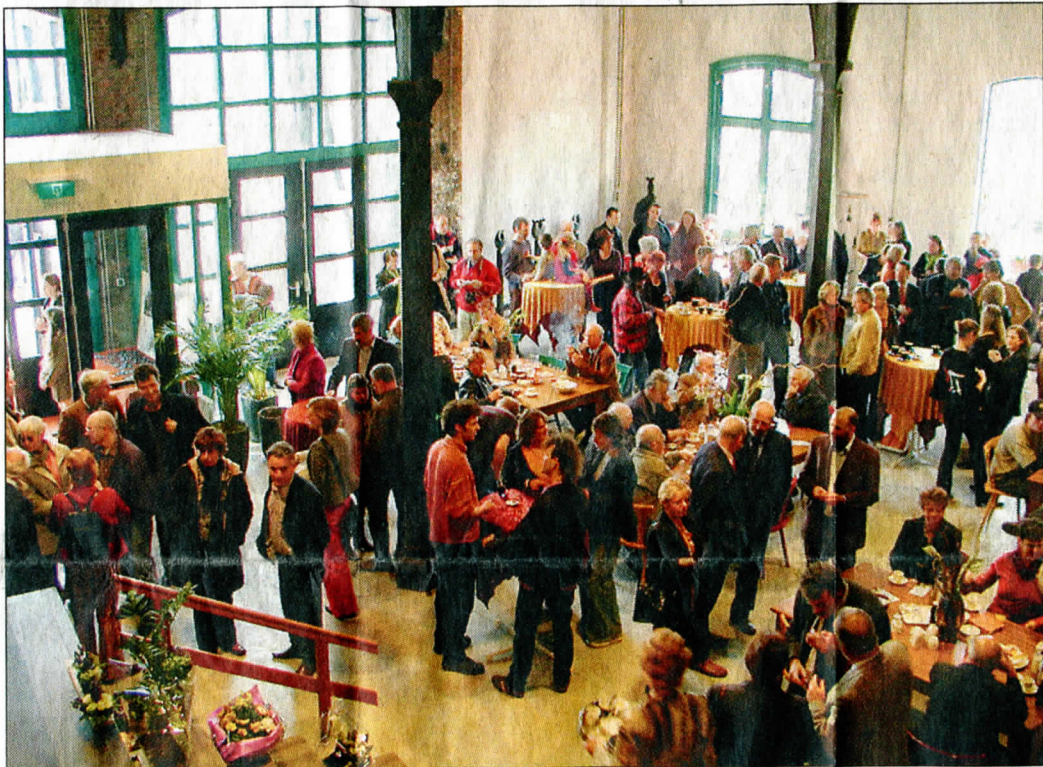
De officiële opening van de Remise was druk bezocht.