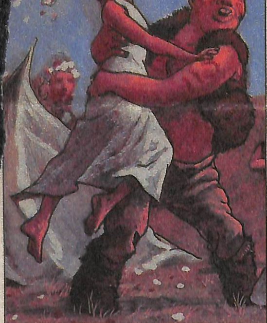
▲ Brüh vindt Ann terug, die op het punt staat uithuwelijkt te worden.