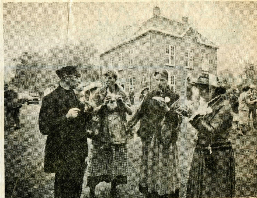
Saucijzebroodjes bij het oude station in Winschoten.

De rit met de oude bussen, en vooral de in ouderwetse kleren gestoken leden van „Plaatselijk Belang” zijn woensdag 22 september op de televisie te zien in „Van gewest tot gewest”, op Nederland 1.