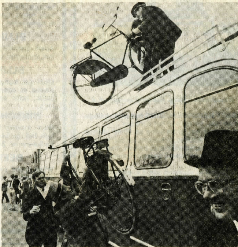
In Oude Pekela moesten er twee fietsen meevervoerd worden.