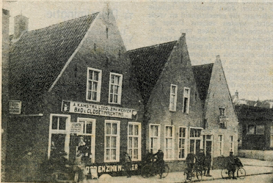
In 1960 werden deze drie huisjes afgebroken. In het laatste (om de hoek) was het logement gevestigd. Links op de foto was de Kruithuisgang.

„Een historisch plekje, daar aan het Zuiderdiep. Jammer dat het allemaal verdwijnt”.