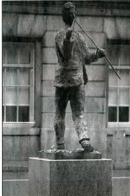
▲ De fluitspeler op het Waagplein.