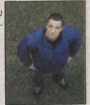
Dance To The Max