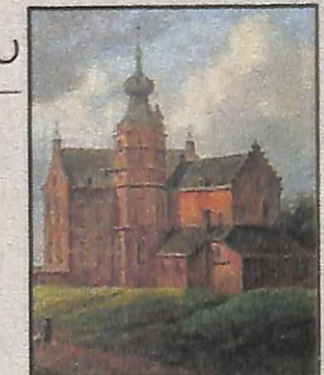
Een 'Nobeltje' op Ballum