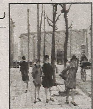
Vleugje Drenthe in Amsterdam